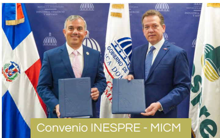
Convenio INESPRES - MICM

El Instituto Dominicano para la Calidad (INDOCAL) y el Instituto de Estabilización de Precios (INESPRE) firmaron un convenio de colaboración con el objetivo de apoyar en las capacitaciones, adquisición de normas y definición de ruta crítica para certificaciones en los procesos de la Norma Internacional de Gestión NORDOM ISO 9001;2015, del Sistema de Gestión Anti-Soborno NORDOM ISO 37001:2016 y el Sistema de Gestión de Cumplimiento ISO 37301:2021