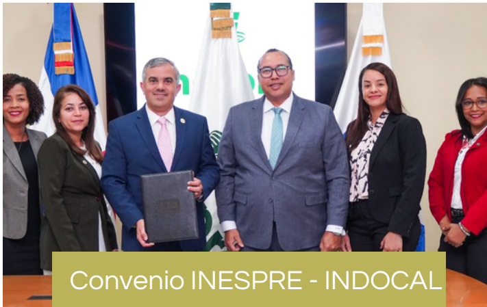
Convenio INESPRES - INDOCAL